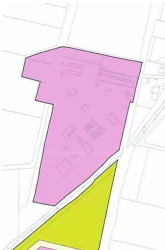
Plano de Usos Pormenorizados

El ámbito de la Modificación se corresponde con la unidad UC-7 de suelo urbano consolidado de uso industrial , cuya delimitación se define gráficamente y que engloba a las parcelas 41, 430, 462, 464, 466, 467, 495, 497 y 498 del polígono 3: