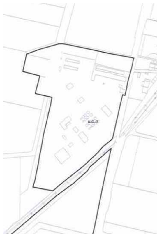
Plano de Desagregación Territorial